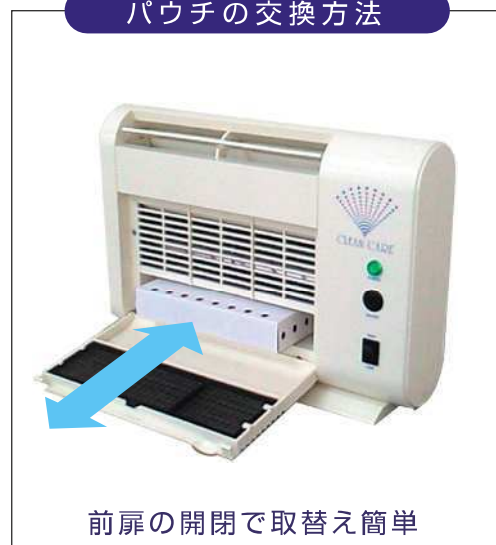
前扉の開閉で取替え簡単